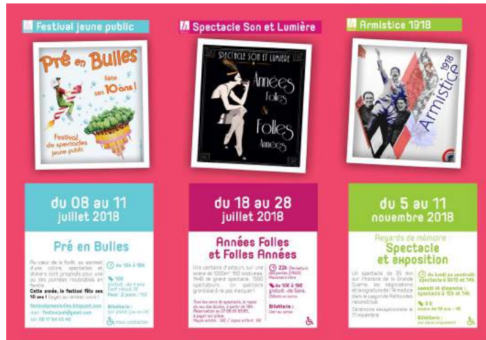
Programme Les Historiales 2018