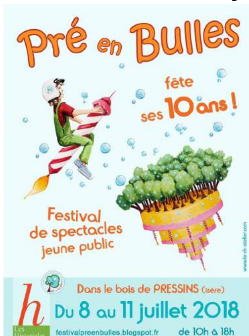
Affiche Pré en Bulles