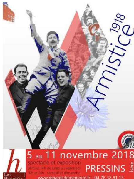
Affiche Armistice 1918