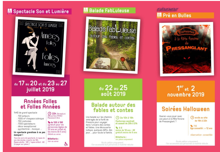
Programme Les Historiales 2019