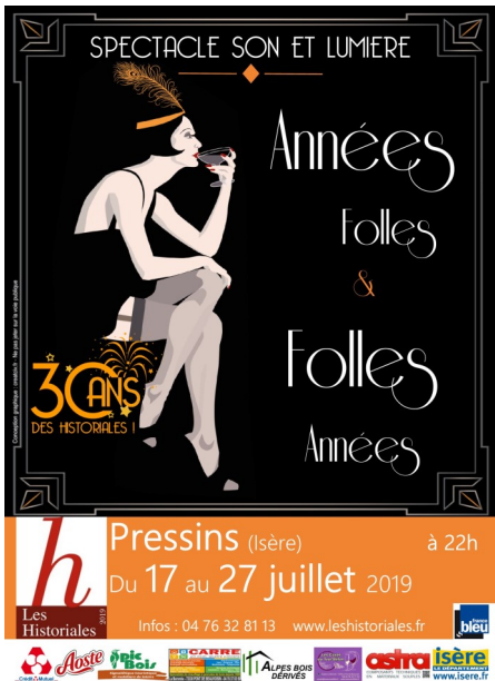
Affiche Spectacle Son et Lumière