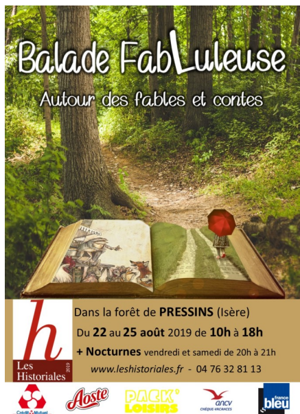
Affiche Balade FabLuleuse